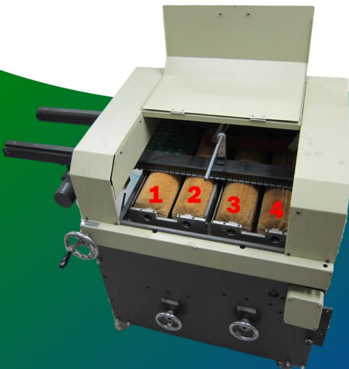
▲ 前面2道毛刷自動沾清潔劑 後面2道毛刷拋洗清潔PC板