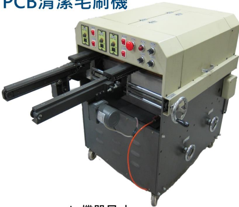
▲ 機器尺寸 120 X 78 X 90 H cm 含前動力導軌